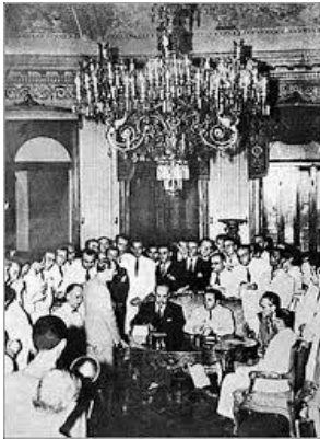
15 al 28 de enero de 1942 – Rio de Janeiro Tercera Reunión de Consulta de los Ministros de Relaciones Exteriores de las Repúblicas Americanas