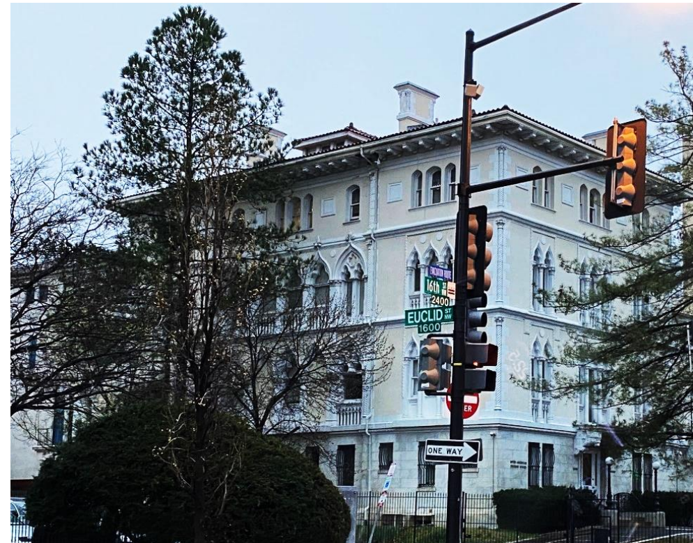
PINK PALACE - CASA DEL SOLDADO 75 AÑOS – SEDE DE LA JID