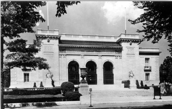
Marzo – Abril 1942 Edificio de la Unión Panamericana