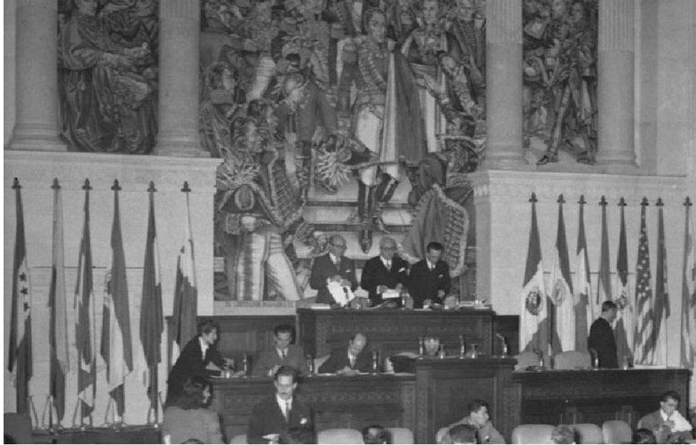
Conferencia que dio origen a la Organización de los Estados Americanos (OEA)