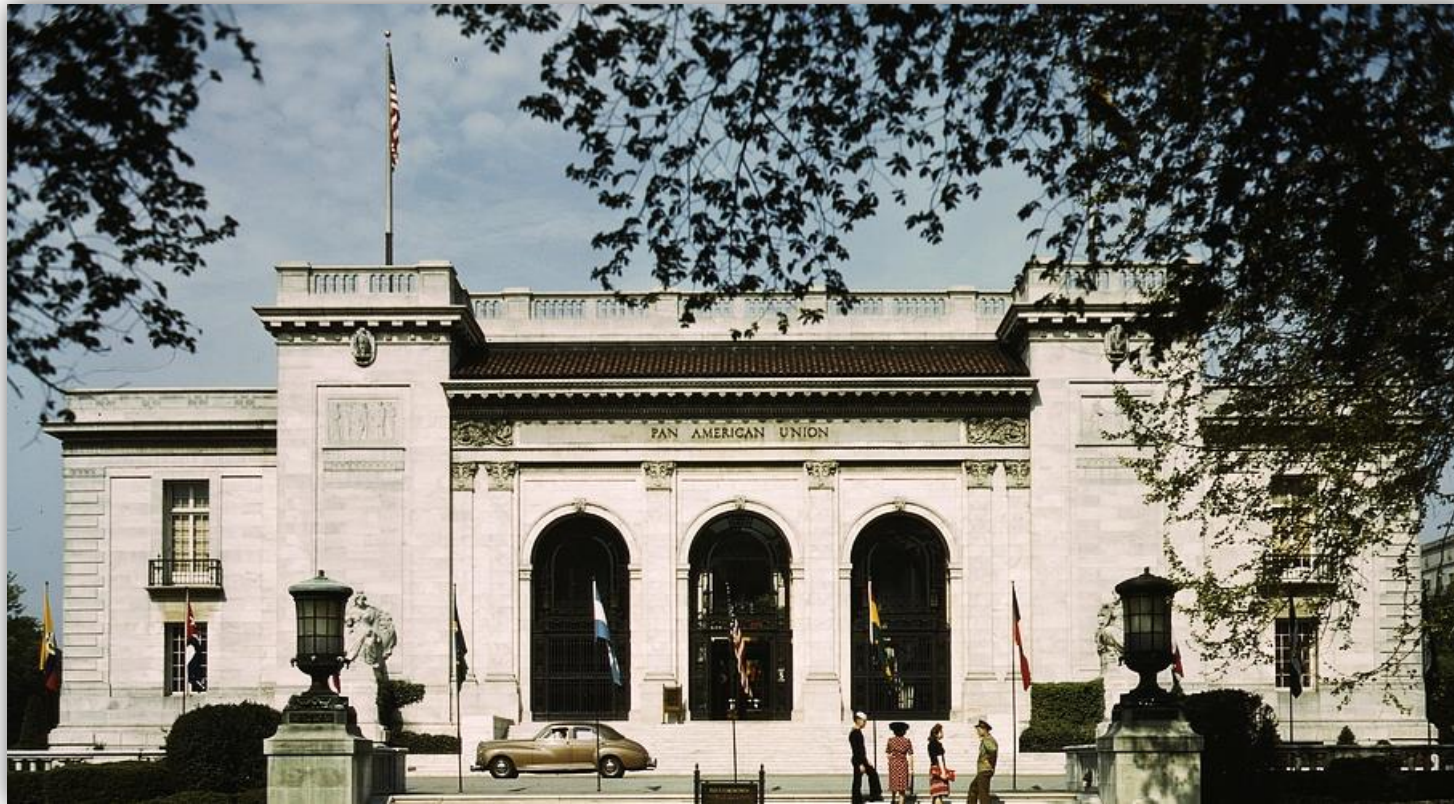
Salón de las Américas del edificio de la Unión Panamericana