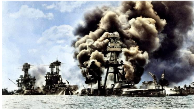
Ataque a Pearl Harbor - 7 de diciembre de 1941