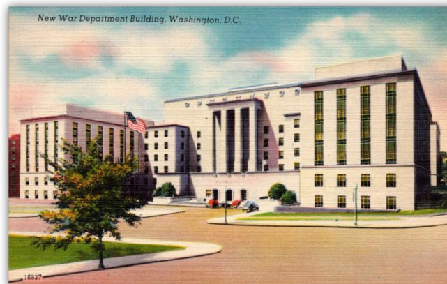
SEPTIEMBRE 1944 – MAYO 1947 New War Department Building (Sede Actual del Departamento de Estado)