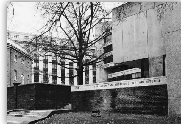
MAYO 1947 – AGOSTO 1949 1735 NEW YORK AVE NW - Actual Sede del Instituto Americano de Arquitectos